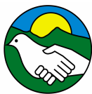
Parco Storico di Monte Sole