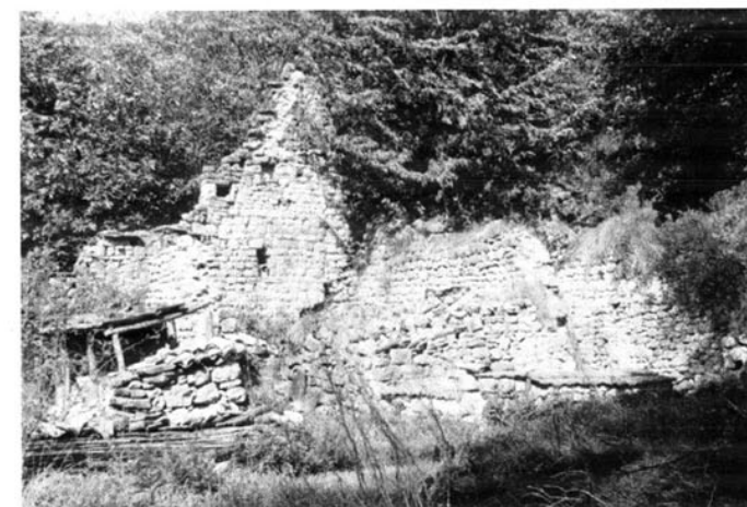
Un'immagine attuale di CAPRARA DI SOTTO.