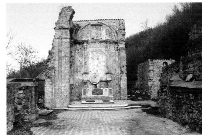
CASAGLIA ai nostri giorni.