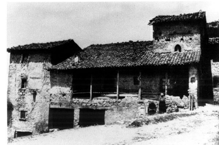
CAPRARA DI SOTTO, antica sede comunale, in una foto di Luigi Fantini del 1939. Collezioni d'arte e di storia della Fondazione Cassa di Risparmio in Bologna.