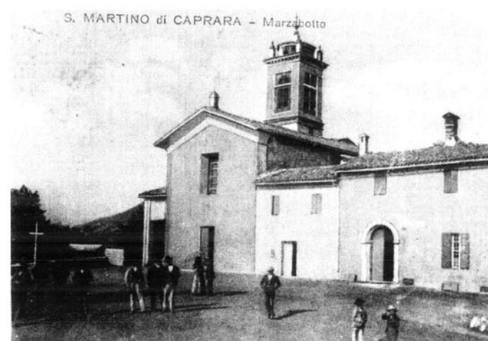
Le due cartoline dei primi del '900 raffigurano SAN MARTINO (in alto) e la chiesa di S. Maria Assunta di CASAGLIA (in basso).

A San Martino morirono complessivamente 65 persone.