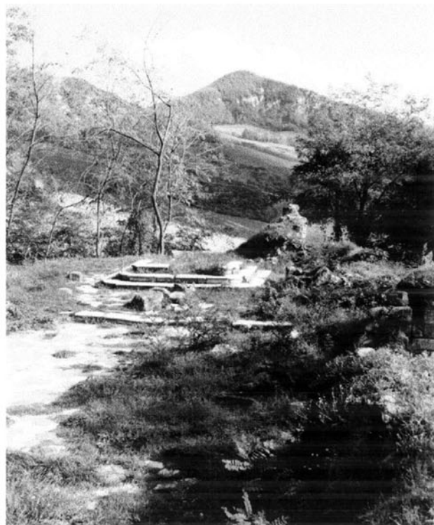
S. MARTINO come si presenta attualmente.